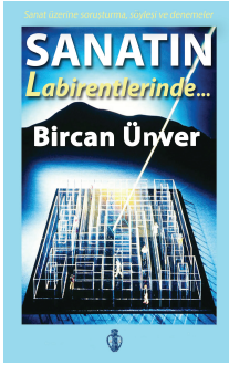
Sanat üzerine Söyleşiler ve Denemeler (2016)